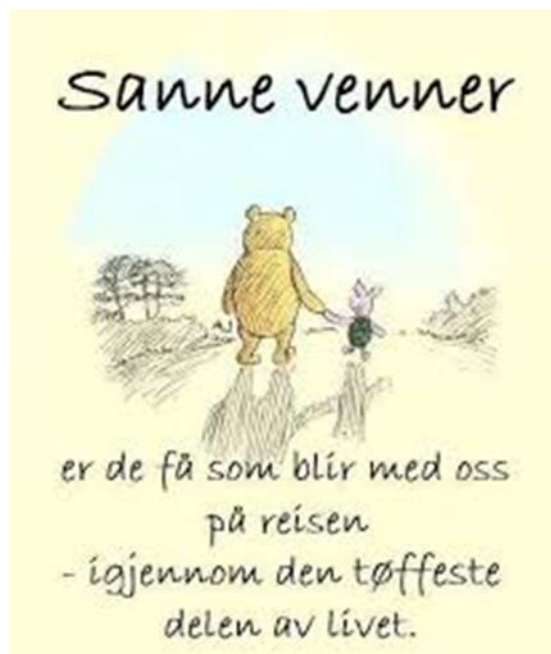
Ole Brum: Sanne venner