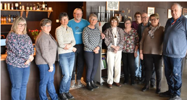
Rode Valdres.

Vi har kaffetreff på Fjordkafen der det er mellom 10 til 17 stk. som møter opp til god mat og trivelig prat.