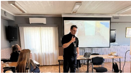
Forteller om brannvern

Etterpå fortsatte diskusjonen over en kopp kaffe og smørbrød.