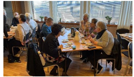
Diskusjon om temaet