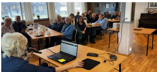
Vi gjetter på Quiz