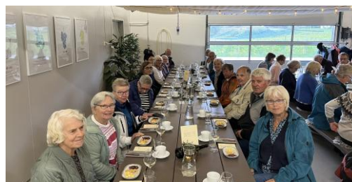
På tur igjen