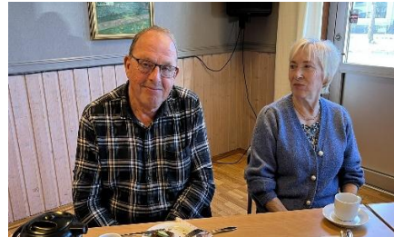
Bivåner det hele