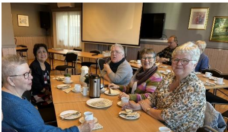
Smakte med kaffe