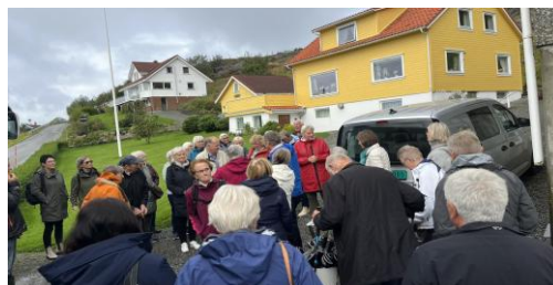
Trangt om plassen på tur