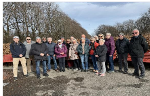
Glade pensjonister i Frognerparken 5. 3.

Mer og oppdatert informasjon om onsdagsturene utover, se Nettsiden vår.