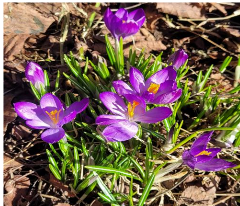
Hilsen fra Rutt Siri

Nå kan resten av året komme! Lysere tider og mere uteaktivitet. Nyt tiden.