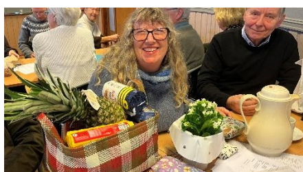
Tenk å vinne det store loddet