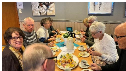
Koser seg med smørbrød