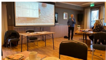
Åpning av årsmøte