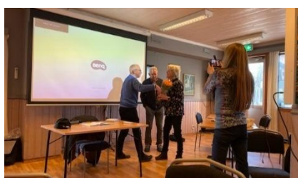
Blomster for god innsats