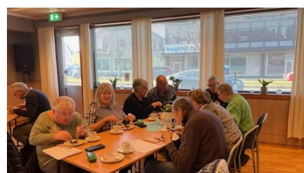
Alle gode ting er tre