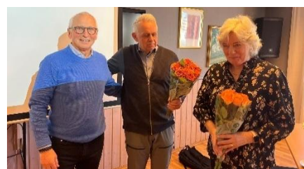
Blomster for god innsats