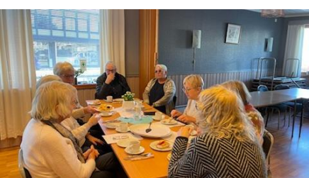
Tid for gode diskusjoner