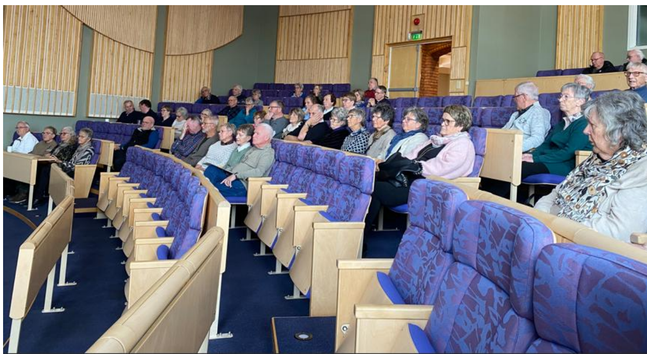
Bilde fra årsmøte på Honne