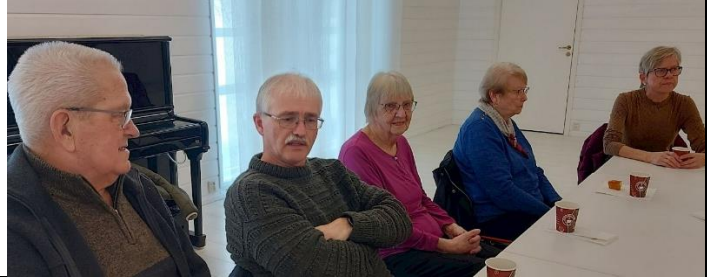
Kaffetreff i Trysil 4. februar