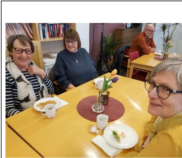
Kaffetreff i Elverum 29. januar