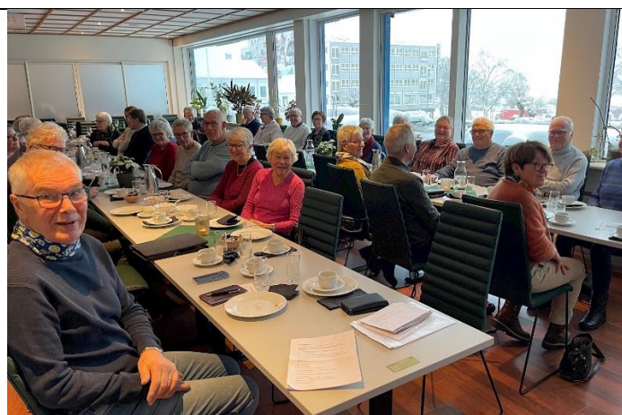
Kaffetreff på Hamar 8. januar