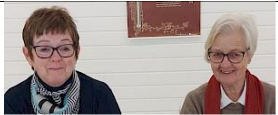
To blide damer fra Engerdal på kaffetreff