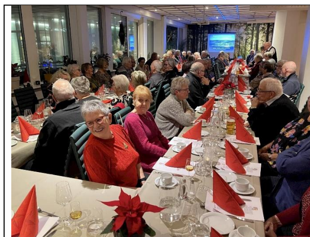
Julemiddag på Hamar 16. desember