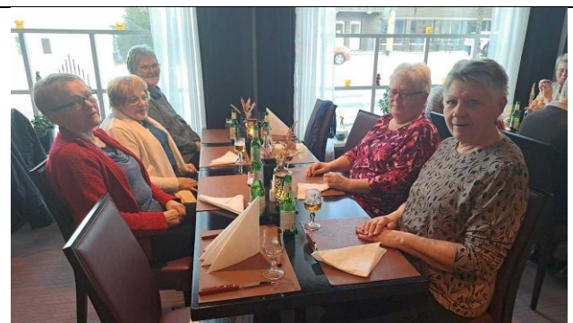
Julemiddag på Tynset 16. desember