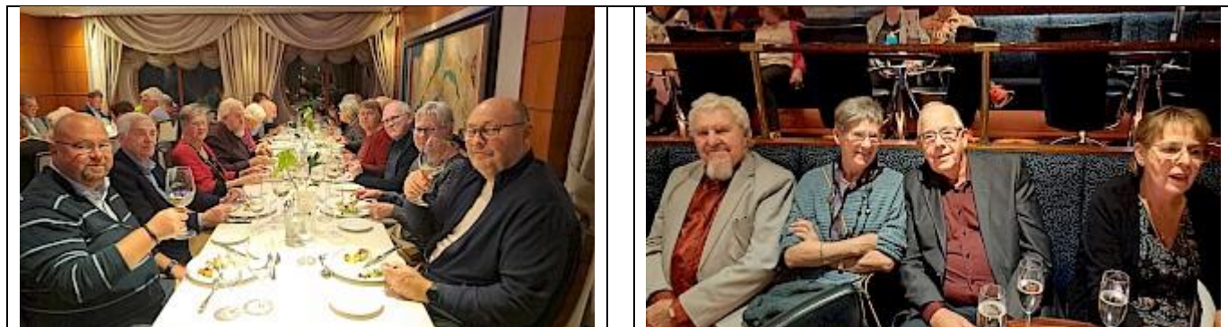
Juletur til Kiel 27. – 29. november