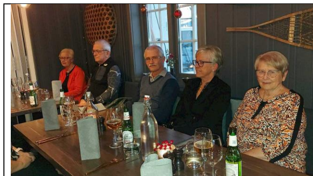
Første julemiddag i Trysil 5. desember