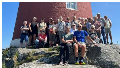
Utflykt til Utsira – Øya mi

I neste utgave av Postpilen vil vi legge fram noen av planene vi har for dette året. Jeg kan garantere at det blir spennende og vi lover å ta dere med på flere dagsturer. Så det er bare å melde seg på og bli med oss.