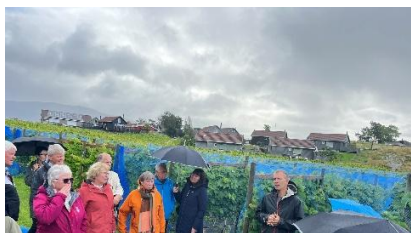
Besøk til Hebnes vingard