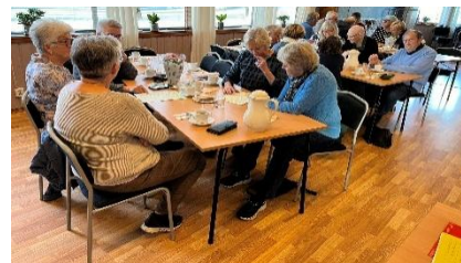
De løser quiz oppgaver