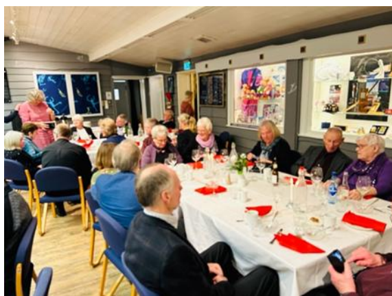
Fra julebordet på Øyer