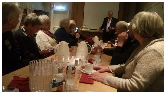
Bilde fra julebord i rode Hadeland

Vi koste oss med god mat og drikke, og praten satt løst.