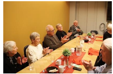
Fra julebespisning i Midtdalen.