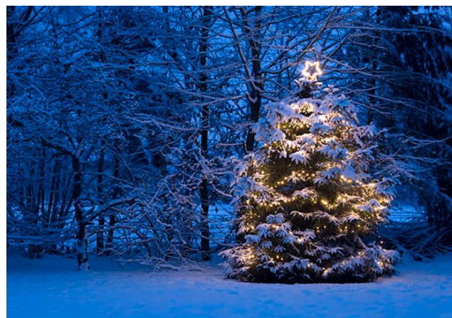
Vinterbilde blåtimen - juletre med lys.