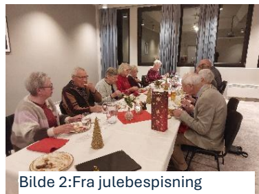
Bilde 2:Fra julebespisning

Vi var einaste julebordlaget på Thon hotell Otta denne kvelden, så vi hadde god plass, og ingen kø ved maten. Vi fekk koldtbord, tradisjonell varm julemat, og sjølvstekt dessert og kaffe. Praten gjekk lett rundt bordet, og fleire historier dukka opp etter kvart.