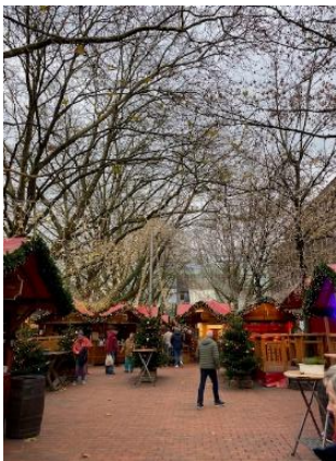
Bilde fra julemarkedet i Kiel.