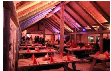
Fra julebord rode Dokka.

Her kommer en liten rapport fra Roden på Dokka. Vi hadde en hyggelig julemiddag på Biffhuset Lavotunet på Dokka den 6. desember. Nydelig mat og god stemning bidro til at 11 postpensjonister sa seg veldig godt fornøyd med kvelden.