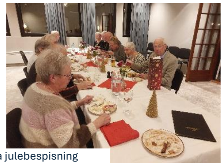
Bilde 1:Fra julebespisning

Vi frå Rode Norddalen ynskjer alle lesarar av Postdølen ei god og fredfull jul.