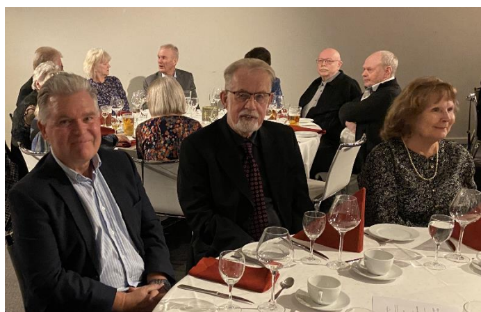
Tekst: Kirsti Stalheim