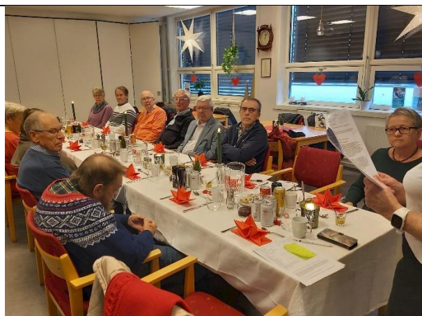
Julelunsj på Møteplassen i Elverum 20. november.