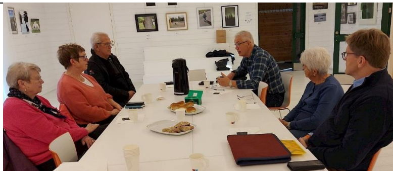
Trysil 30. oktober: På Biblioteket fant vi endelig et flott møtelokale