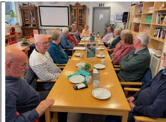
Kaffetreff i Elverum 30. oktober