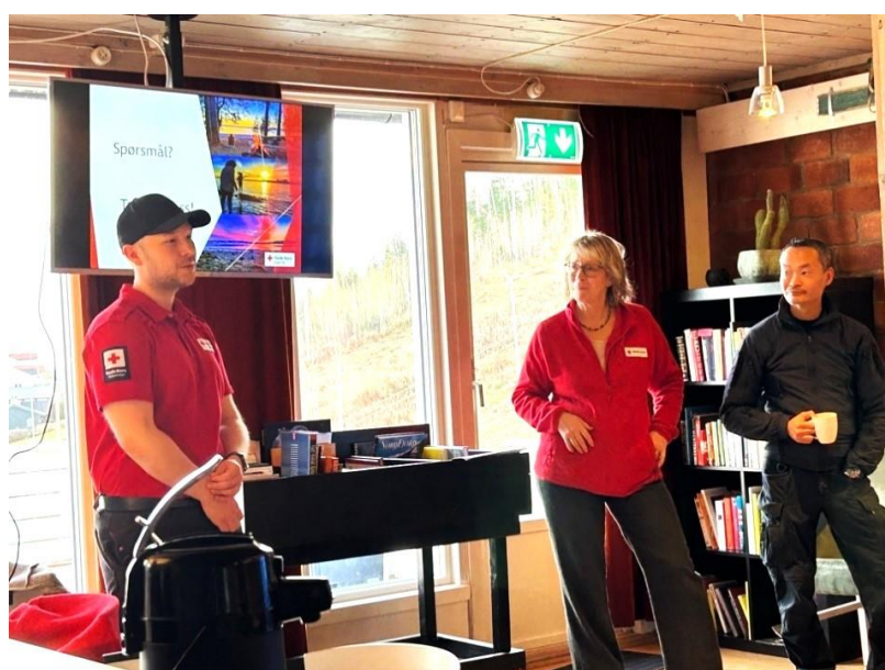
Gjøvik Røde Kors forteller om sin virksomhet på Gjøvik