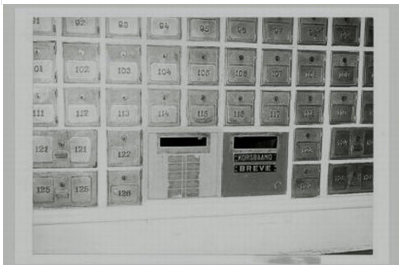
Tekst og foto: Norges Postmuseum

Ordningen fikk endelig formelle regler gjennom Postloven av 1871. I de byene hvor brevombæring var innført kunne private brev "forlanges særskilt afsatte til Afhenting mod at derfor erlægges 1 spd. for Kvartelet".