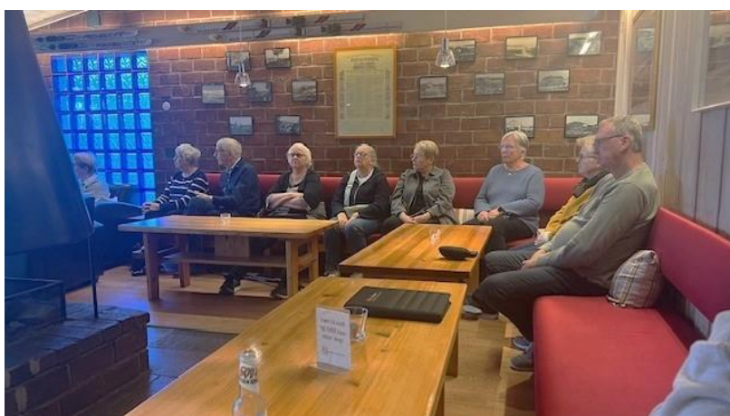
Bildet viser at de fram møtte følger godt med på info fra Gjøvik Røde Kors

Så ble det det vanlige lotteriet hvor noen ble glade og noen ble skuffet . Vi serverte kaffe og kaker som vi betalte av egen kasse .