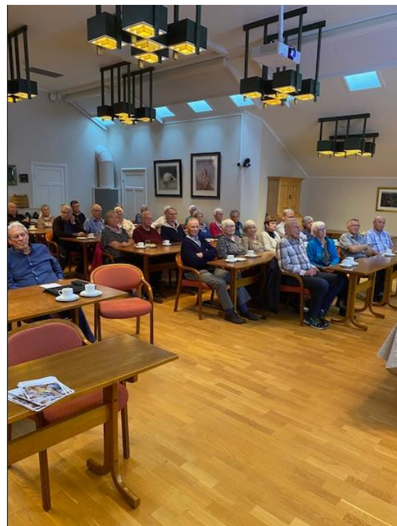
Interessant tema fra talerstolen