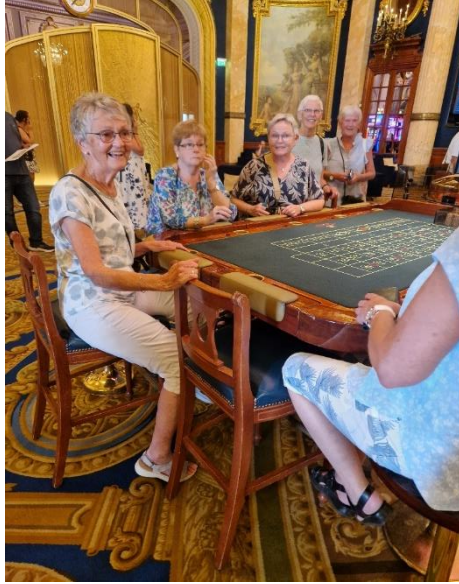
Bilde fra Casino