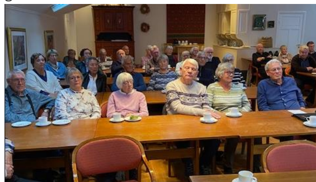
Deltakere på medlemsmøtet.