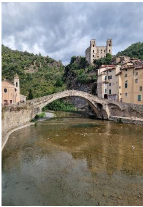
Bilde fra San Remo.

Kveldens middag på en lokal restaurant i nærheten av hotellet ble en liten nedtur. Det ble veldig lenge å vente på maten, det gikk en god time før første rett ble servert og det gikk ikke fortere med resten heller.