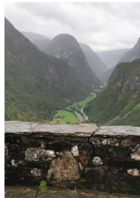
Utsikt frå Hotell

Kjekk tur til Stalheim hotell og Aurlandskoen for 31 personar.