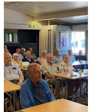
Deltakere på medlemsmøte på Hafjell