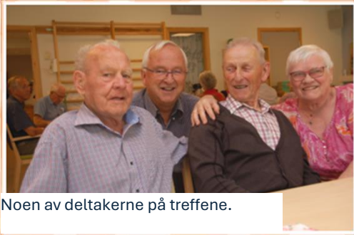
Noen av deltakerne på treffene.

Det var et lykkelig valg. Det ble til sammen 3 treff i juli måned. Fremmøte var det ikke noe å si på. Til det første treffet kom det litt under 30. Det neste samlet godt over 30 og til det siste juli-treffet kom det litt færre enn 30. Når det denne måneden til sammen var nærmere 100 personer innom kan vi kanskje tolke det som at det var et behov for en prat selv i feriemånedens.