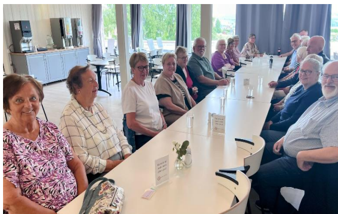
Bilde 2 Sommeravslutning på Hovdetun