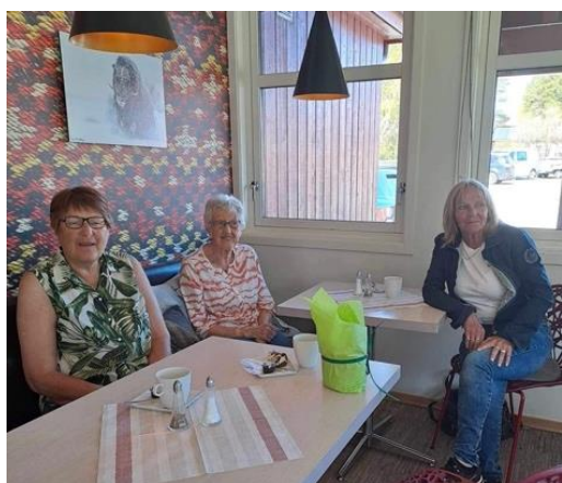
Bilde 1 Sommeravslutning Dombås/Lesja