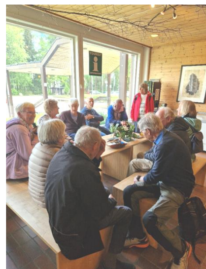
Norsk Skogmuseum på Elverum