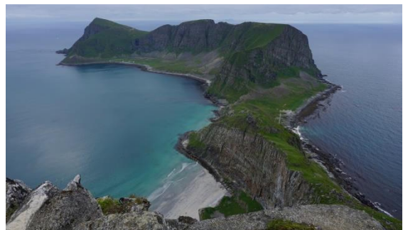
Utsikt mot Mostad