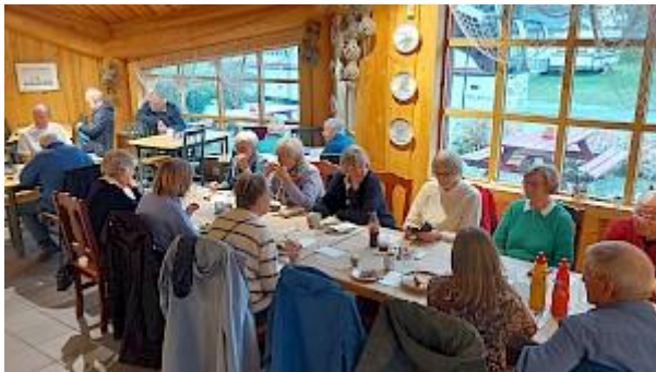
NORDNES KRO SALTDAL MO I RANA TORGET

Så var det på tide å sette nesen nordover igjen. En liten kaffestopp med "hemnesværing" som føde til kaffen litt nord for Storforshei. Middagsstopp på Nordnes kro før vi var hjemme igjen. En flott tur i flotte høstfarger og ikke minst et flott møte med tidligere kolleger innlagt i turen.