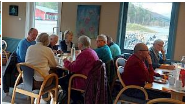
KROKSTRAND FJELLPARK MO I RANA SENTRUM