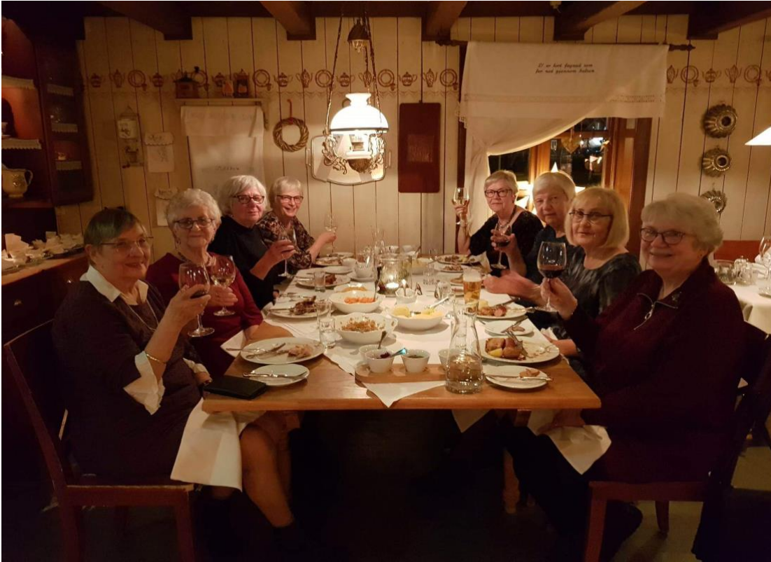
8 medlemmer møttes til julebord 30.11, på Kjøkkenet i Svolvær. Julemat, godt å drikke + julegaver, i god gammel postånd.