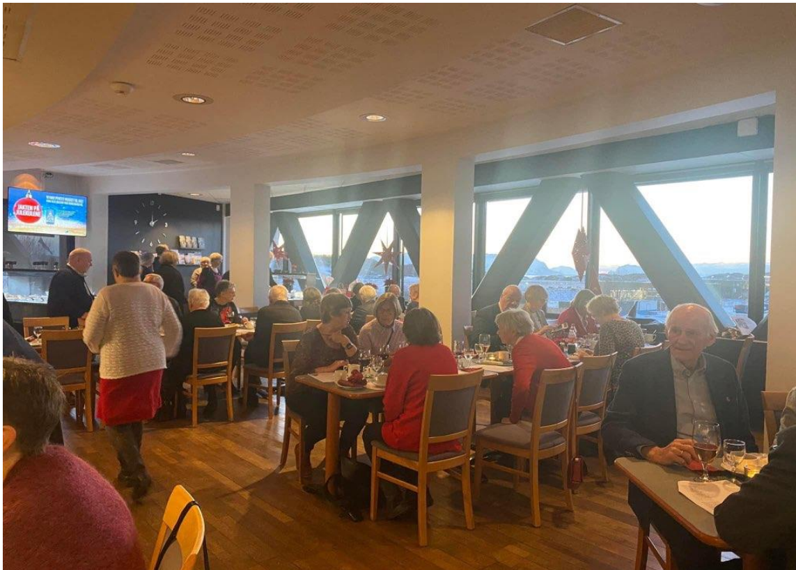
43 medlemmer møtte 10.12 til tradisjonell julelunsj på kafe Gidsken på Flymuseet. Det var julemat, julesanger, dikt og historie, Quiz og loddsalg.