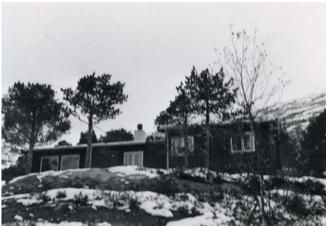
305 Sagstua sett fra sjøsida