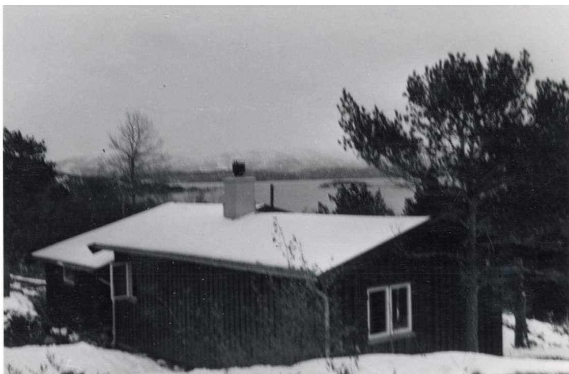
307 Sett ovenfra med Saltfjorden i bakgrunnen