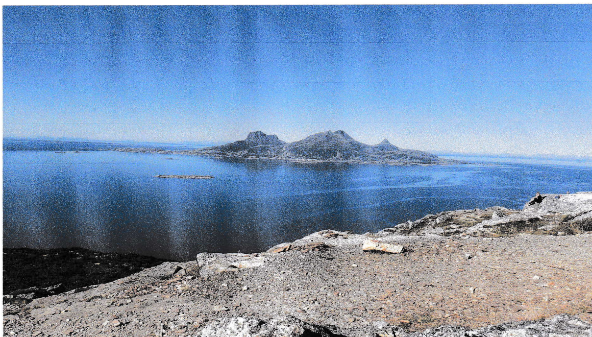
En høstdag på Keiservarden