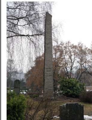
Per Sivle bauta

Det vert buss frå Førde 22 august kl 10:00.