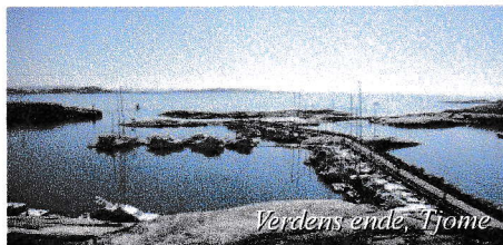
Verdens ende, Tjøme