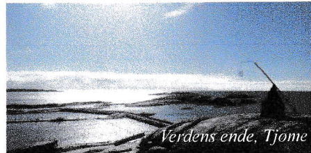
Verdens ende, Tjøme